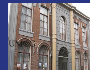
LUTHERSE KERK GRONINGEN