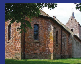
ST. MAGNUSKERK ANLOO