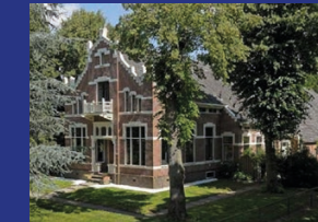
CONCERTBOERDERIJ D'RENTMEESTER VALTHERMOND