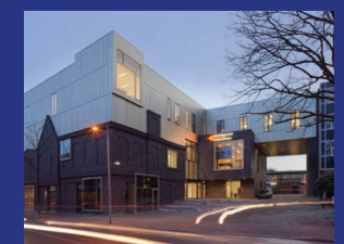
PRINS CLAUS CONSERVATORIUM GRONINGEN