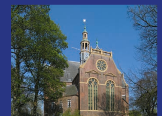
NIEUWE KERK GRONINGEN