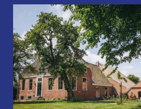
OP MAARHUIZEN WINSUM