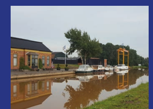
WOUDBLOEM MARINE SERVICE